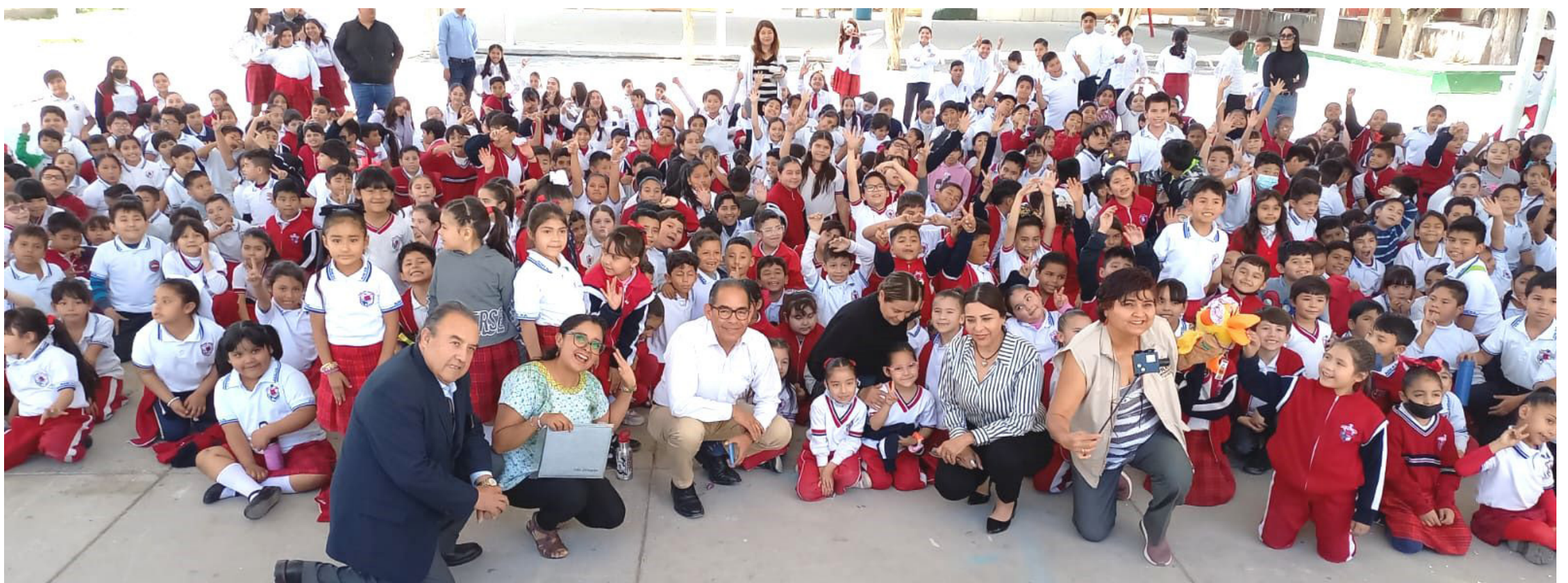
Cierre de presentaciones en la Escuela Primaria “Anexa a la Normal” de Torreón, Coahuila.