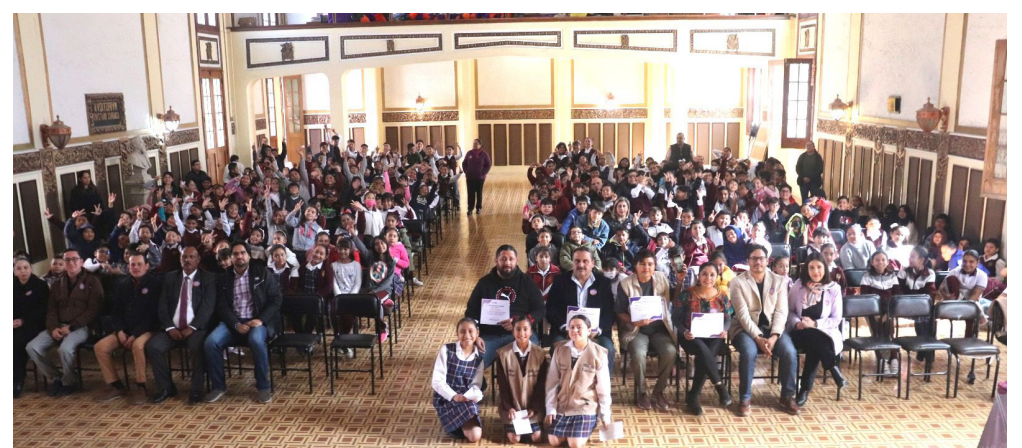
El arranque de las presentaciones dio inicio en el auditorio de la Escuela Primaria "Coahuila" del T.M de Saltillo, Coahuila.